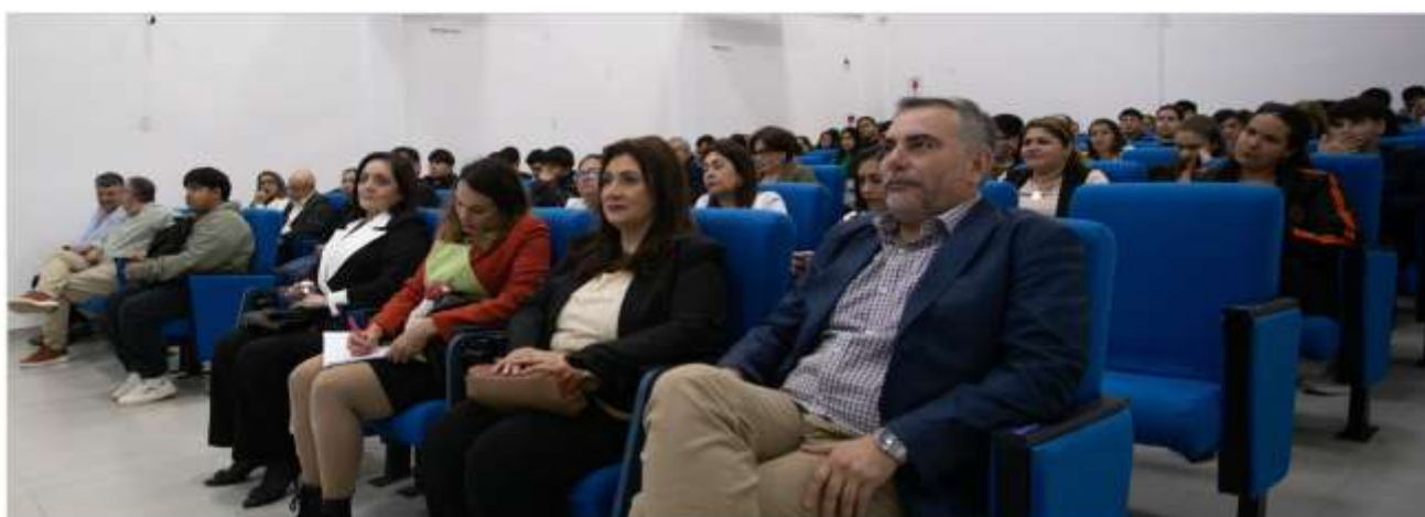
Auditorio participante del Acto de Apertura de Encuentro de Divulgación Científica

Dirección de Investigación- Universidad Nacional de Asunción-Paraguay