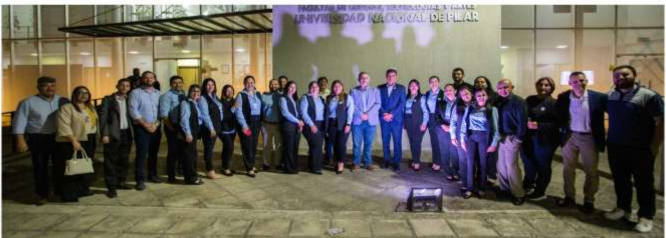
Equipo Organizador y Autoridades Invitadas – Encuentro de Divulgación Científica “Ciencia para el Desarrollo Sostenible y la Integración del Conocimiento”