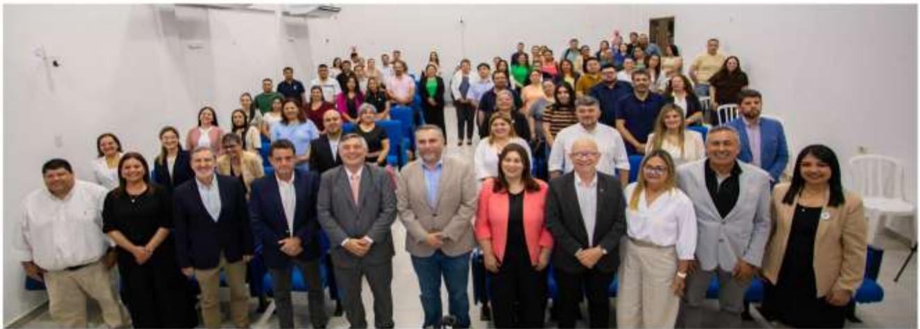
CIERRE DEL ENCUENTRO DE DIVULGACIÓN CIENTÍFICA Cierre del Encuentro de Divulgación Científica con la presencia de autoridades académicas de la institución y del Ministro de Educación y Ciencias (MEC) de Paraguay, Don Luis Fernando Ramírez